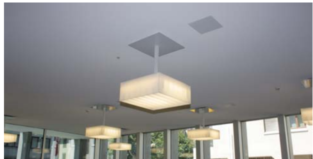
Auslass unsichtbar hinter Leuchte integriert