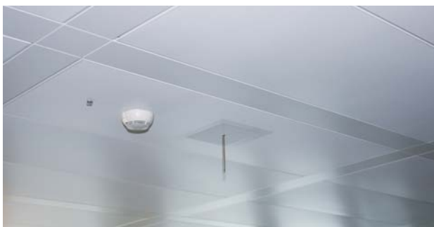
Technikplatte mit Indikator, Brandmelder und im Luftauslass integrierten Temperaturfühler