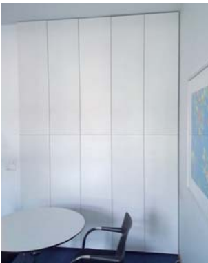
SonoPerf® (mikrogeschlitztes absorbierendes Akustikblech)

Aufgesetzte Wandkonstruktion mit Umlenkungsschikanen im luftführenden Wandvorbau. Durch den erhöhten Wärmeübergang an der Wandrückseite wird die Zuluft auf Einblasttemperatur erwärmt. Luftzuführung z. B. über Laminauslass im Sockelbereich, oder Wandoberflächen aus Gips, Holz, Stoff oder Metall.