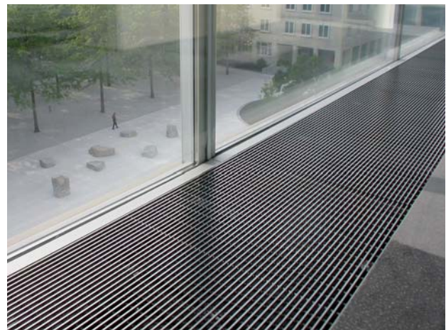
Bodengitter mit integriertem Bodenluftauslass und Heizkörper