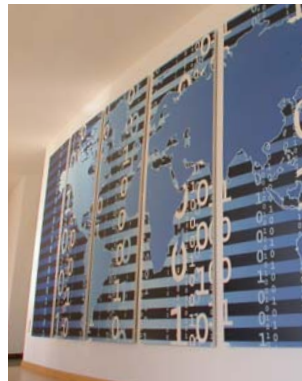
Metallpaneele SonoPerf® mit Motivdruck