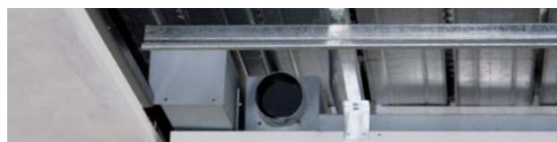
Anschlusskasten Abluft und Zuluft mit Verteilkanal in Deckenfries integriert