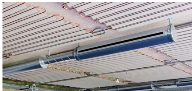
In Spirorohr integrierter Schlitzauslass