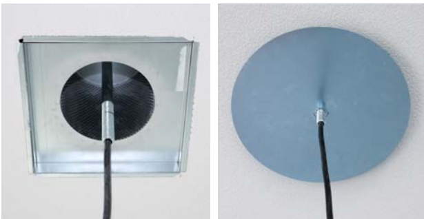
«Innenleben» Luftauslass in Doppeldecke mit Befestigungsstange für Leuchte