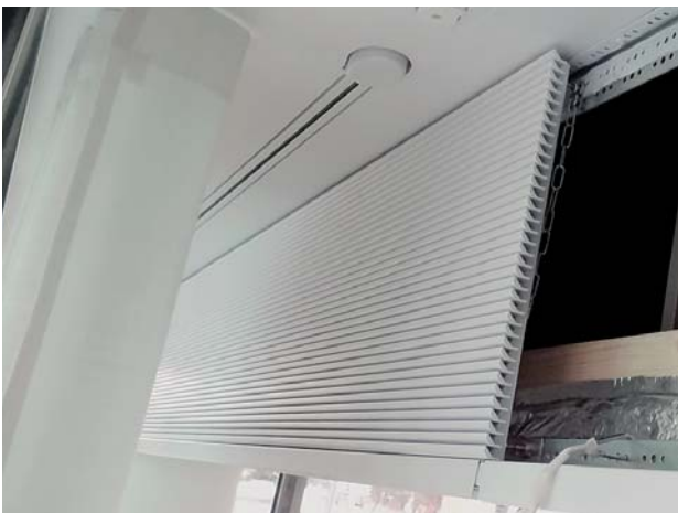
Abluftgitter mit Kettensicherung

Basierend auf Ihren Vorstellungen und Anforderungen erarbeiten wir für Ihr Objekt die technisch sowie ästhetisch optimale Lösung.